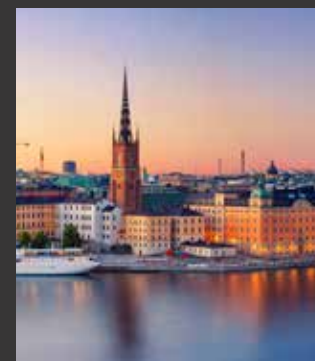
Kontaktintensitet Stockholm - Oslo

Konferansen Smart Mobility Norway ble arrangert den 7. september på Norges Varemesse i Lillestrøm. OREEC (Oslo Renewable Energy and Environment Cluster) og Norges Varemesse arrangerte fagkonferansen og utstillingen med temaet «Bærekraftig næringsutvikling innen transport.» Osloregionen var samarbeidspartner og deltok med en egen stand på arrangementet. Osloregionen deltok også i det faglige programmet på konferansen med foredrag i sesjonen Norsk næringsutvikling og nye norske transportløsninger.