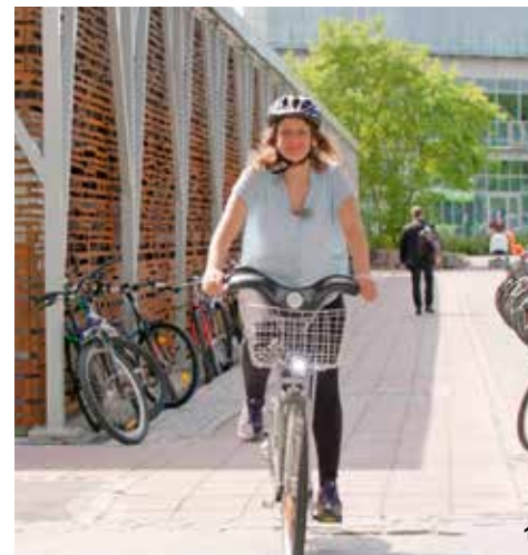
1 Sykkelbyen Lillestrøm, fra Osloregionens ATP-film

NTP og de siste årenes utvikling i godstransport til og gjennom Osloregionen, viser at det er behov for å følge opp problemstillinger knyttet til godstransport. I vedtatt NTP vises det til kommende konseptvalgutredning for terminalstruktur for Oslofjordområdet. I påvente av kommende utredninger og den utfordringen godsproblematikk er for Osloregionen, ble det i slutten av 2017 initiert et gods- og logistikkprosjekt.