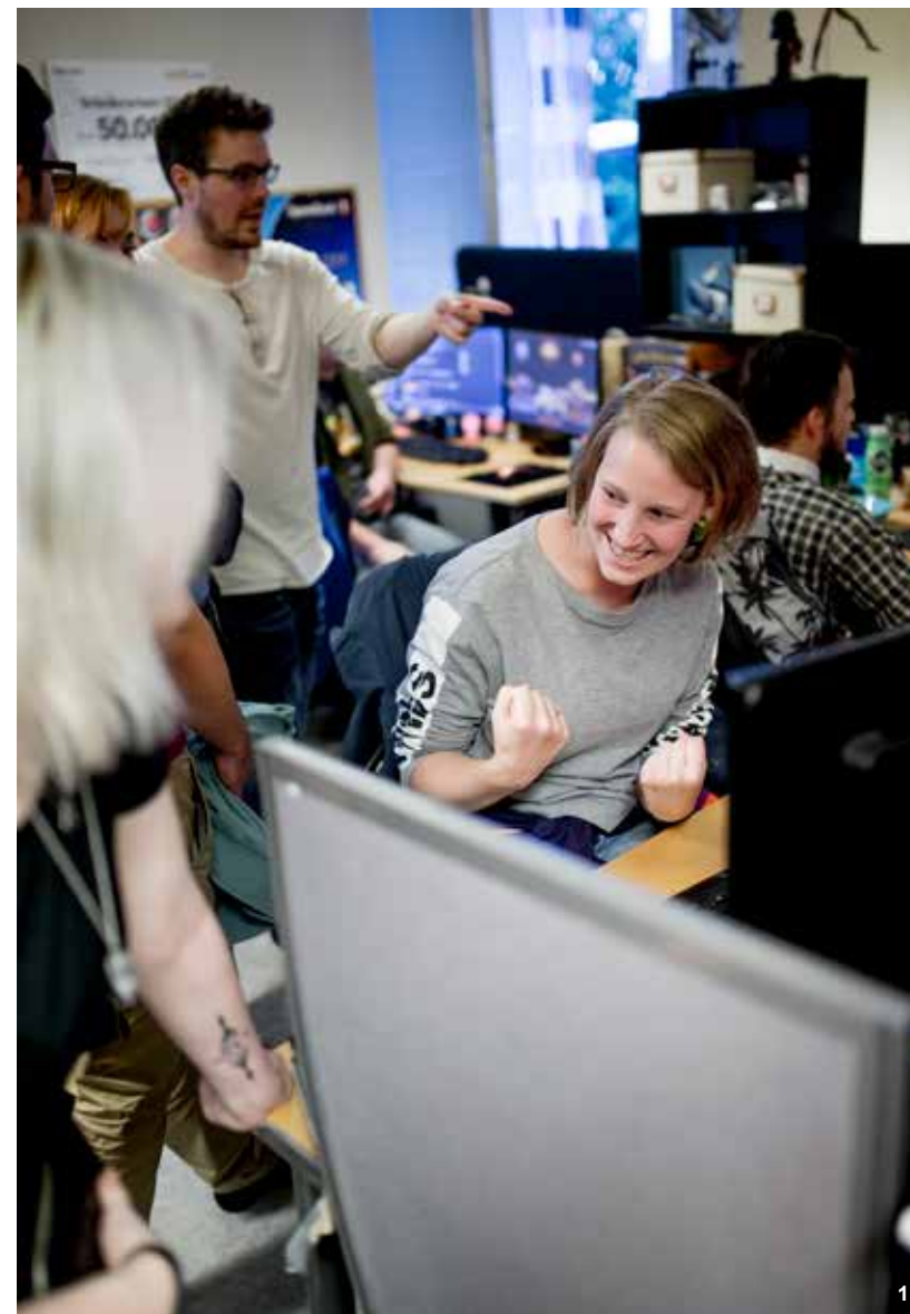
1 Hamar Game Collective

Leder av Osloregionens styre Byrådsleder i Oslo kommune