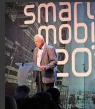
Smart Mobility Norway

På konferansen deltok flere av Osloregionens medlemmer med stand i Folketeaterpassasjen. Dette var en felles stand fra kommunene Holmestrand, Sande, Hof, en stand fra Mossregionen og en fra Hamarregionen, i tillegg til Osloregionens stand.