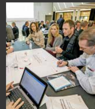
Samarbeid på næringsområdet

I samarbeid med Mälardalsrådet, Stockholms Läns Landsting, Stockholm- Oslo 2:55 og Akershus fylkeskommuner, har Osloregionen tatt initiativ til utarbeidelse av en rapport som ser på integrasjon mellom næringsliv og akademia i Stocholmsregionen og Osloregionen, og forbindelsene mellom de to byregionene. Arbeidet blir gjennomført av konsulentselskapet SWECO og forventes å foreligge i april 2018.