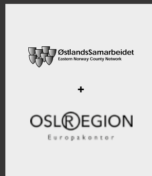
Tettere samarbeid med Østlandssamarbeidet og Osloregionens Europakontor

Høsten 2017 har sekretariatet i Osloregionen deltatt på regionrådsmøter som observatør og for å informere om Osloregionens arbeid. I løpet av 2017 har sekretariatet deltatt på møter i Vestregionen, Nedre Glomma Regionråd, Samarbeidsrådet for Nedre Romerike, Hadelandsregionen og Kongsbergregionen. Osloregionen deltok også på oppstartsseminar i juni om areal og transportstrategi for Mjøsbyen, der det ble gitt en presentasjon av areal- og transportstrategien.