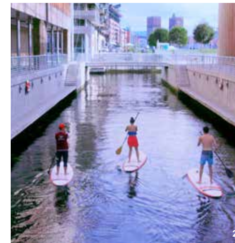
2 Bilde fra filmen «The great escape Oslo»