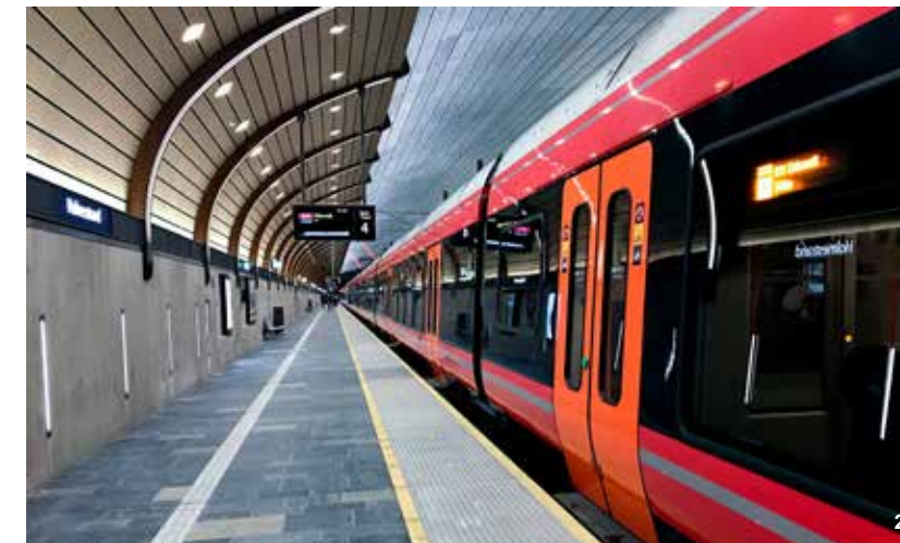
2 Holmestrand stasjon

Prosjektet vil starte opp i 2018. Prosjektet vil være viktig i den videre dialogen med nasjonale myndigheter.