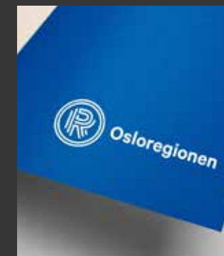
Kommunikasjonsmaterieil - ny designmanual

Osloregionen har i 2017 videreført samarbeidet med NHO Oslo og Akershus om BEST-konferansen. Osloregionen har også samarbeidet med Nasjonalt program for leverandørutvikling. Samarbeidet med Innovasjon Norges klyngeprogram er i løpet av året styrket, og vil bli ytterligere videreutviklet i 2018. Sekretariatet har i 2017 også styrket samarbeidet med Næringsforum Oslofjord Vest som representerer næringsrådene i Nedre Buskerud samt Asker og Bærum.