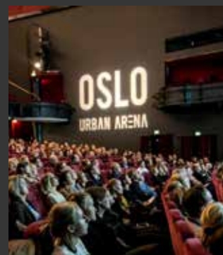
Oslo Urban Arena

BEST-konferansen arrangeres årlig og er den viktigste utviklingskonferansen for Osloregionen. Som tidligere år, ble konferansen arrangert i samarbeid med NHO. Konferansen veksler mellom bærekraftig utvikling og internasjonal konkurransekraft som tema. BEST 2017 hadde tittelen «Bypolitikk og byutvikling». Se omtalen over i kapittelet Areal, Transport og Klima. En egen programkomite med deltagelse fra Osloregionen og NHO var ansvarlig for å lage programmet.