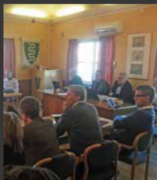
Deltakelse på regionrådsmøter og andre regionale arrangement

Høsten 2017 har sekretariatet i Osloregionen deltatt på regionrådsmøter som observatør og for å informere om Osloregionens arbeid. I løpet av 2017 har sekretariatet deltatt på møter i Vestregionen, Nedre Glomma Regionråd, Samarbeidsrådet for Nedre Romerike, Hadelandsregionen og Kongsbergregionen. Osloregionen deltok også på oppstartsseminar i juni om areal og transportstrategi for Mjøsbyen, der det ble gitt en presentasjon av areal- og transportstrategien.