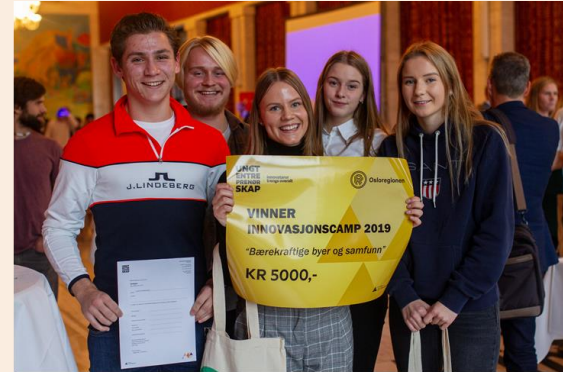
1. plass: Frederik II vgs