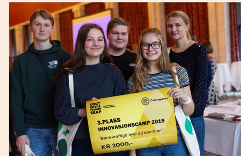
3. plass: Hamar Katedralskole