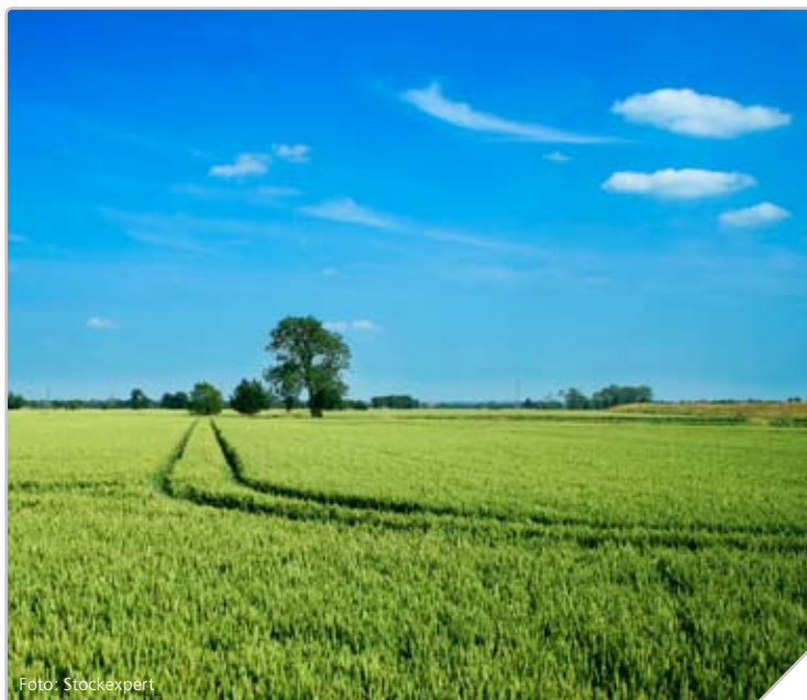
Osloregionen dekker til sammen ca. 14 400 km 2

Utgangspunktet for prosjekter og tiltak knyttet til kompetanse og verdiskaping er en analyse av Osloregionen som et nasjonalt tyngdepunkt for kunnskapsbasert næringsliv. Osloregionens oppgave er å legge til rette for at dette fortrinnet styrker regionens internasjonale konkurransevne. Det regionale samarbeidet gir mulighet for bedre sammenheng