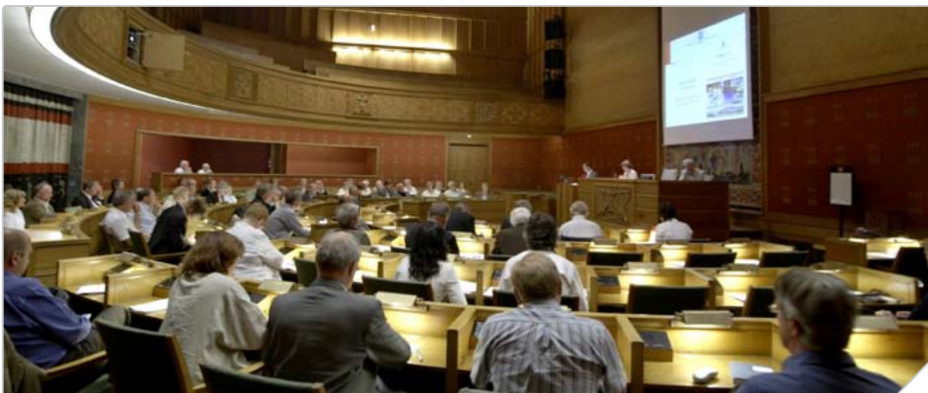
Møte i samarbeidsrådet, juni 2007.