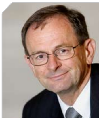
Byrådsleder Erling Lae

Samarbeidsprosjektet om internasjonal profilering "En kunnskapsprofil og Osloregionen" ble ferdigstilt sommeren 2007. Innenfor Osloregionens regionale program for næringsutvikling har blant annet oppfølgingen av Hovedstadsprosjektet og regionens fem sterke næringsklynger stått på dagsorden. Begge prosjekter utgjør kjernen i hovedmålet om å øke regionens internasjonale konkurransekraft, og gjennomføres i partnerskap mellom flere regionale aktører. Dette er samarbeidsformer og satsningsområder som jeg forventer vil få økt oppmerksomhet i årene som kommer.