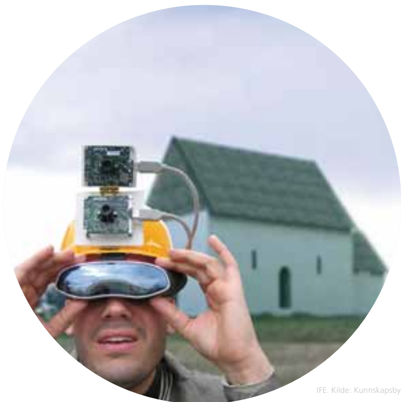
IFE. Kilde: Kunnskapsbyen.

Høsten 2008, i etterkant av rådets vedtak, ble det utarbeidet skisser til prosjekt- og aktivitetsplaner for oppfølging av strategiene. Viktige avklaringer var knyttet til hvilket ambisjonsnivå man skulle legge seg på; ressursmessig, organisatorisk og økonomisk. Det ble også fokusert på rekruttering av deltagere inn i aktuelle fag- og prosjektgrupper. Formell igangsetting av nye prosjekter ble satt til januar 2009.